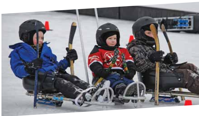
Démonstration de hockey sur luge au Bal de Neige annuel à Ottawa.

Le développement d'un système sportif de premier ordre est essentiel au succès du Canada sur la scène paralympique internationale et pour réaliser notre vision d'être au premier rang mondial en tant que nation paralympique. L'objectif du CPC est d'être un chef de file dans le développement et le maintien d'un système durable pour augmenter considérablement le nombre de personnes ayant un handicap qui participent à une activité physique à tous les niveaux. Collectivement, notre but est de faire en sorte que tous les participants, athlètes, entraîneurs, officiels, classificateurs et bénévoles potentiels sachent comment s'engager dans le parasport et aient l'occasion de réaliser leur plein potentiel parasportif.