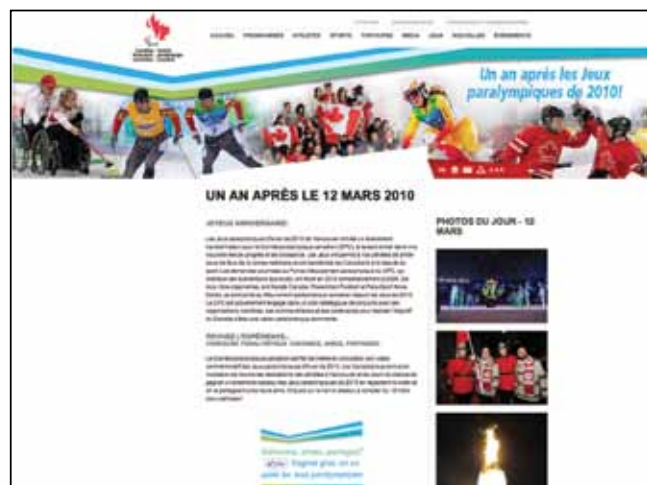
Concours dans les médias sociaux pour les célébrations du premier anniversaire.

Nous partagerons toutes ces ressources avec nos membres pour les aider dans leurs efforts de sensibilisation à leurs athlètes et leur sport.