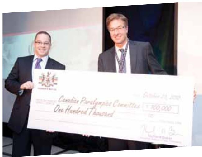
La Compagnie de la Baie d'Hudson remet 100 000 $ au CPC.

Nous avons effectué une étude de marché et consulté des experts en matière de commandites pour établir un cadre stratégique ambitieux orienté vers le succès qui nous permettra d'atteindre nos objectifs à long terme en matière de revenus.