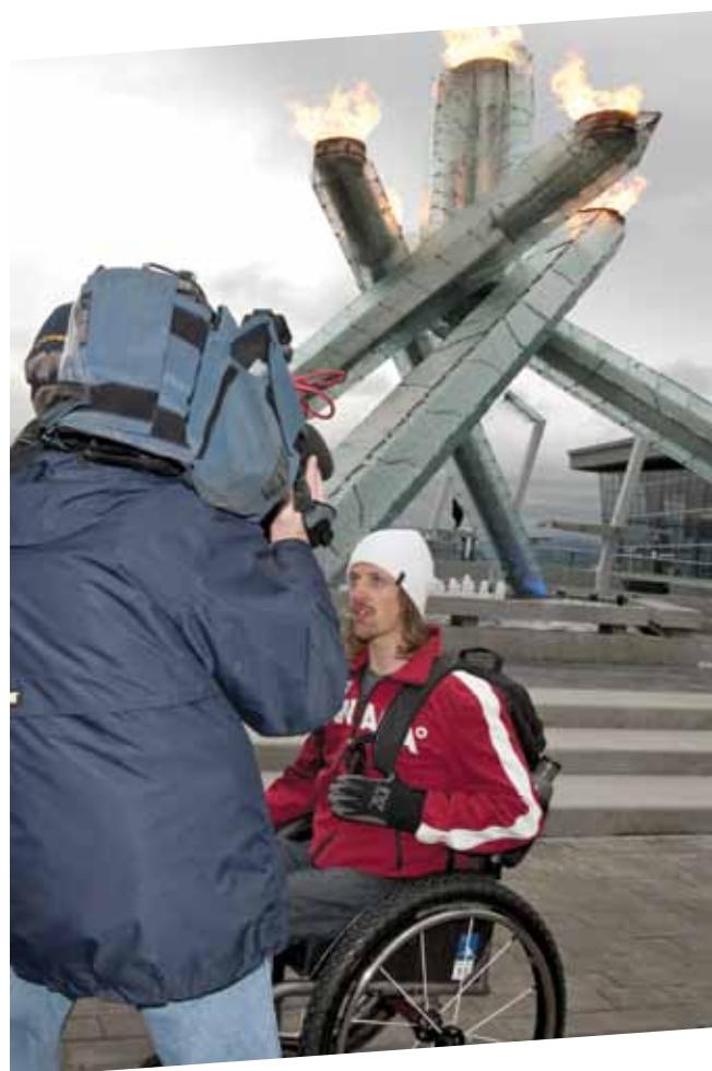
Le paralympien Josh Dueck interviewé à l'occasion du premier anniversaire des Jeux paralympiques d'hiver de Vancouver 2010.

Aussi, les dates charnières, comme l'anniversaire des Jeux paralympiques de Vancouver 2010 en mars 2011, sont transformées en célébration. À lui seul, cet événement a fait l'objet de 25 millions d'impressions.